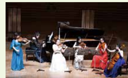
2017.5.13 藝大プロジェクト 「ピバリエスバーニャーグラナダスのスペイン」ヨーロッパの迎撃～スペインの音楽