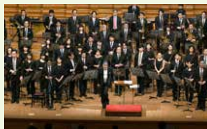
2018.1.7 藝大プラス「一期一会」