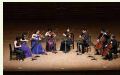
2017.5.21 弦楽シリーズ シヨスタコーヴィチの肖像