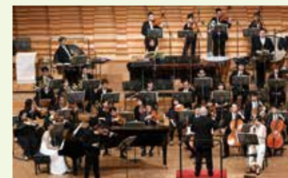
2017.6.02 創造の社 藝大現代音楽の夕べ