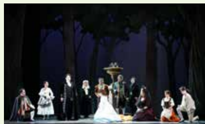
2017.10.7～8 藝大オペラ定期 モーツァルト「フィガロの結婚」