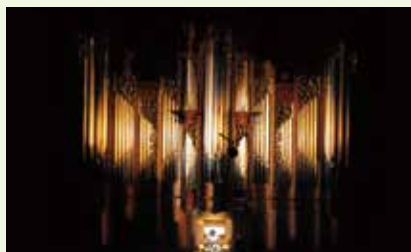
2017.11.3 上野の森オルガンシリーズ フレスコバルディへのオマージュ