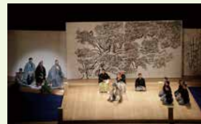
2017.9.14 和楽の美 源平の盛衰〜有為転変賦