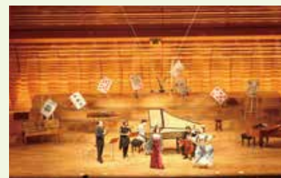
2017.7.01 藝大とあそぼう 古楽の考古学