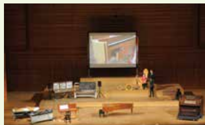
2018.1.7 鍵盤楽器「未来永劫」