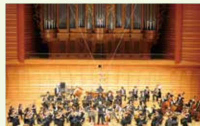
2017.6.9 藝大フィルハーモニア管弦楽団定期