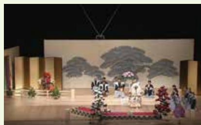
2018.1.6 邦楽「百花繚乱」石橋