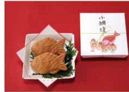
お祝い事に小鯛焼