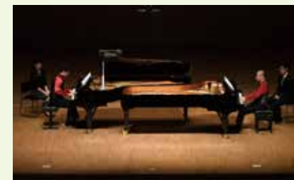
2017.11.5 ピアノシリーズ ピアノデュオの楽しみ