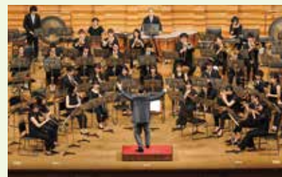
2017.5.11 管打楽器シリーズ 吹奏楽の響き～フランスの響き