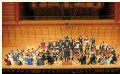
2018.1.8 藝大130周年記念オーケストラ「温故創新」