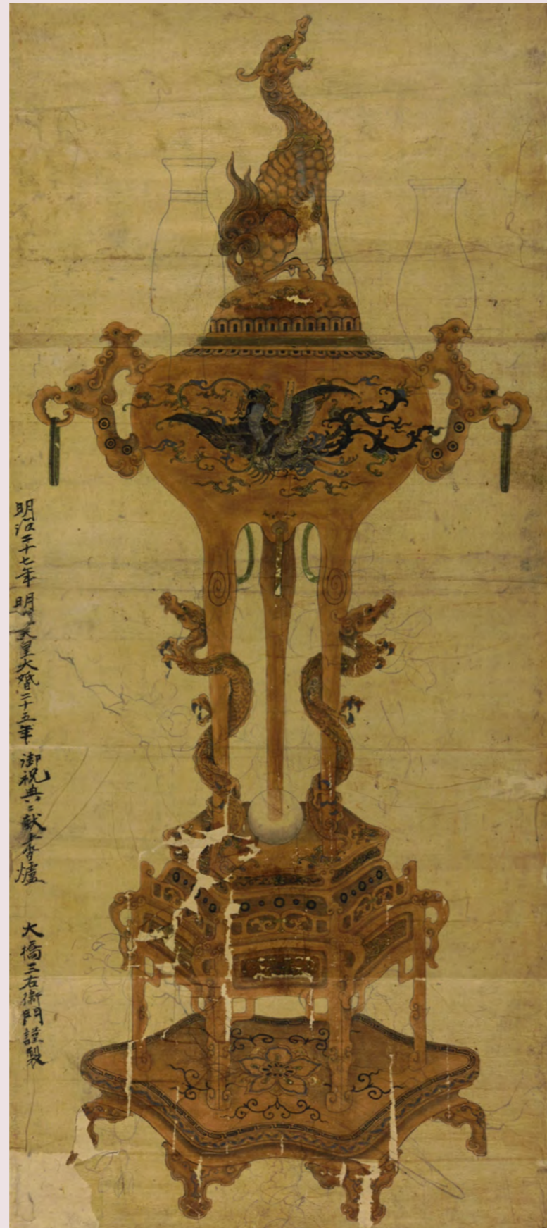
古銅龍巻香炉下絵 (大橋家下絵)

富山県高岡市の伝統的工芸品である高岡銅器の歴史は江戸初期の高岡開町とほぼ同時にはじまります。