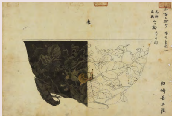
豆に蝸牛文花斛下絵 (大橋家下絵)