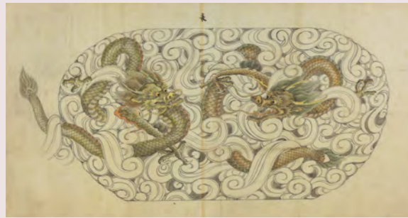
雲龍文図 (大橋家下絵)