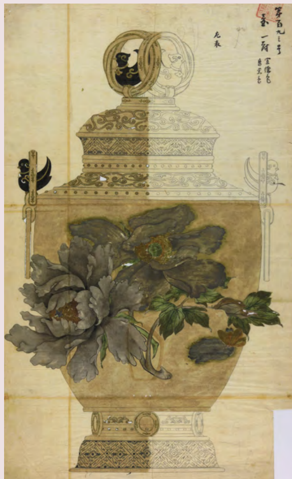
牡丹文壺下絵 (大橋家下絵)