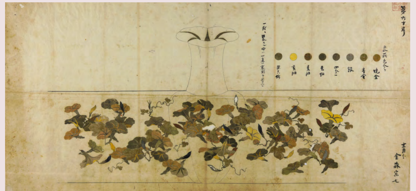
散朝顔文象嵌花瓶下絵 (金森家下絵)