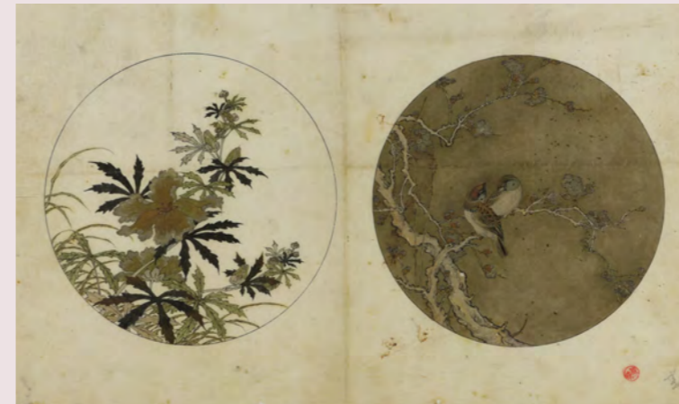
花鳥文扁壺形花瓶下絵 (金森家下絵)