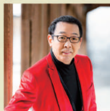
さだまさし (シンガー・ソングライター、小説家)

1955年、和歌山市生まれ。'79年、東京藝術大学大学院音楽研究科修了。ロン＝ティボー、ヴィエニャフスキ、ミュンヘンなどの国際コンクールに入賞。イザイ・メダル、ボルドー音楽祭金メダル受賞など、ヴァイオリニストとして国際的に活躍。'90年、澤クワルテット結成。'96年、指揮活動開始。2004年、和歌山県文化賞受賞。'15年、英国立音楽院名誉教授。副学長、音楽学部長を経て、'16年4月より東京藝術大学長。