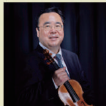
澤和樹 (ヴァイオリニスト)

1955年、和歌山市生まれ。'79年、東京藝術大学大学院音楽研究科修了。ロン＝ティボー、ヴィエニャフスキ、ミュンヘンなどの国際コンクールに入賞。イザイ・メダル、ボルドー音楽祭金メダル受賞など、ヴァイオリニストとして国際的に活躍。'90年、澤クワルテット結成。'96年、指揮活動開始。2004年、和歌山県文化賞受賞。'15年、英国立音楽院名誉教授。副学長、音楽学部長を経て、'16年4月より東京藝術大学長。