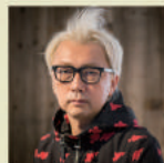
箭内道彦 (クリエイティブディレクター)

1952年生まれ、長崎県出身。73年にフォークデュオ「グレープ」を結成、76年にはソロシンガーとして活動開始。2019年5月15日セルフカバーアルバム「新自分風土記」2タイトル同時発売、又、昨年11月20日に行われた「45周年記念コンサートツアー 2018Reborn～生まれたてのさだまさし～」ライブ映像作品3形態が6月26日に発売された。現在全国コンサートツアー中。